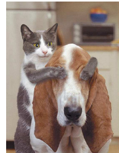
Les chats et chiens

Réponse du mois dernier: le saumon atlantique