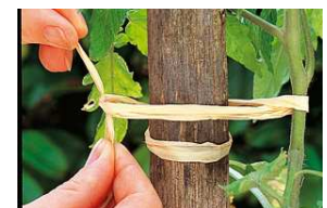
Tuteurage plants de tomates